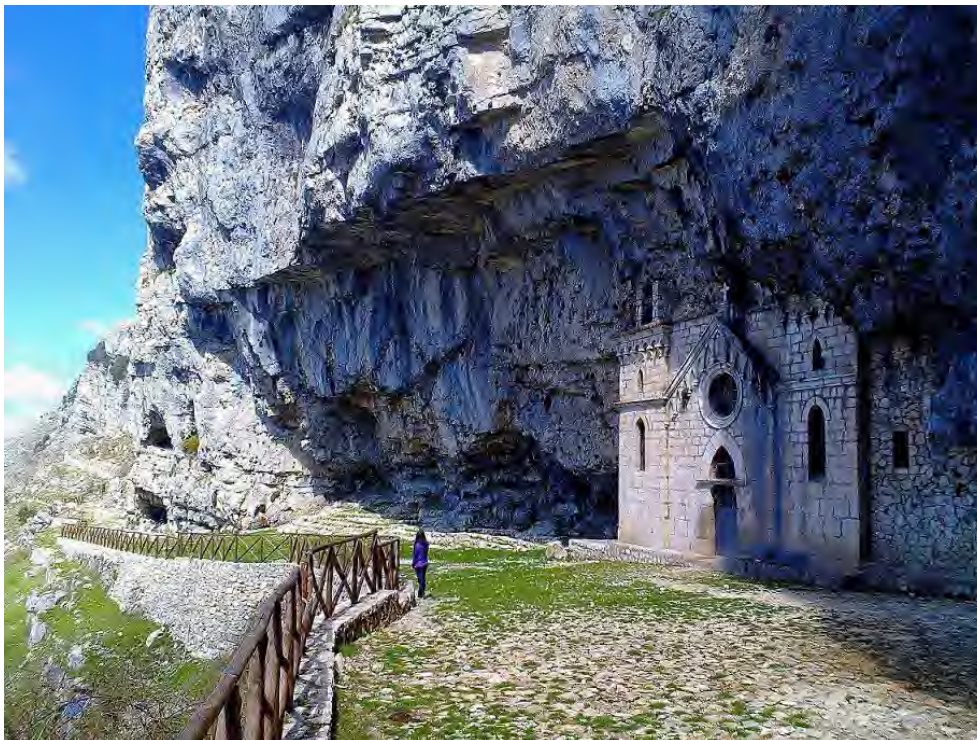
Autore: Fabio Gargiulo – Parco Regionale dei Monti Aurunci (Lazio)