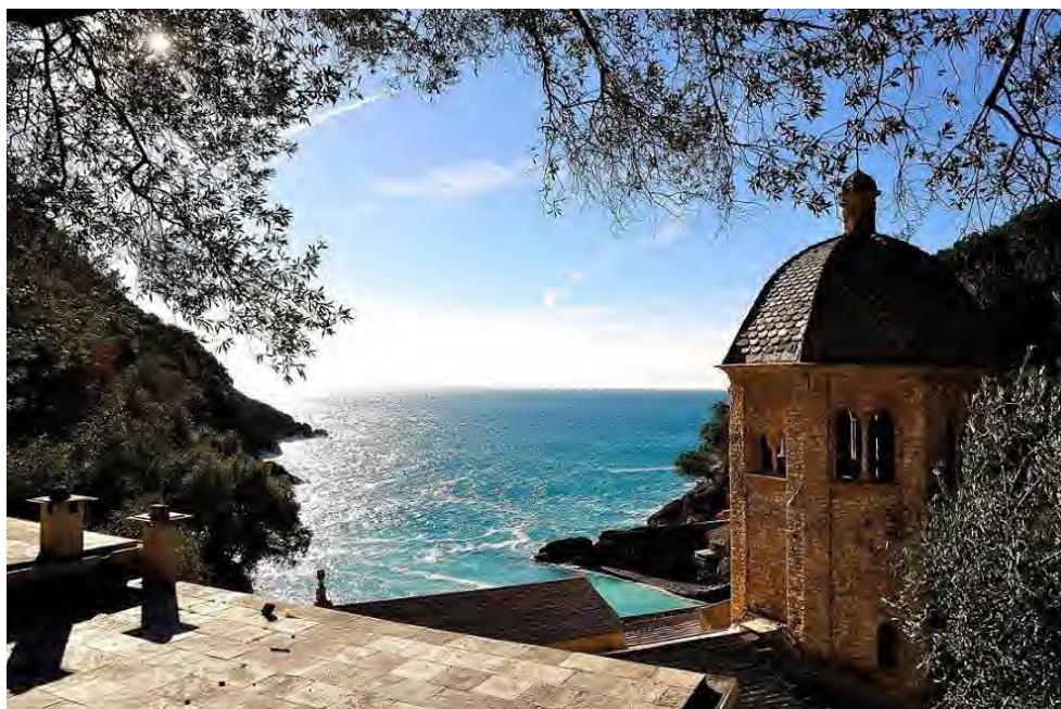
Autore: Maurizio Beatrici – Parco Regionale di Portofino (Liguria)