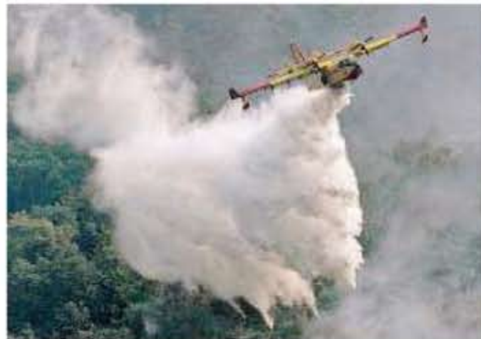
Un canadair in azione per spegnere un incendio

1.200 LE FIAMME Oltre 1.200 incendi boschivi in Italia nei primi sei mesi dell'anno 4.000 GLI ETTARI Oltre 4.000 ettari la superficie totale percorsa dal fuoco dall'inizio dell'anno 24 A RISCHIO In 24 province è concentrato il 75% degli incendi boschivi degli ultimi tre anni